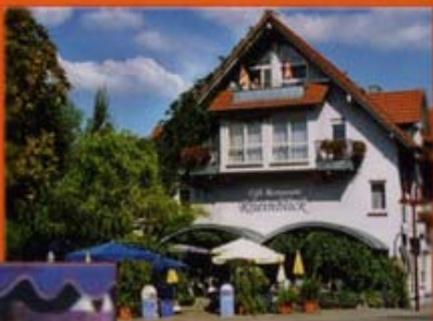
Unsere beliebte Terasse